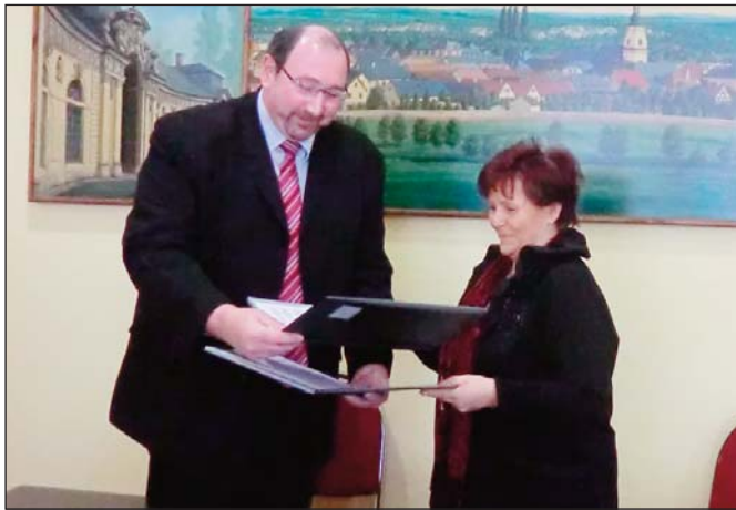
Unterzeichnung des Vertrages mit der EWA

in Meuselwitz verantwortlich, es wurden Hausanschlüsse und -anschlussleitungen erneuert.