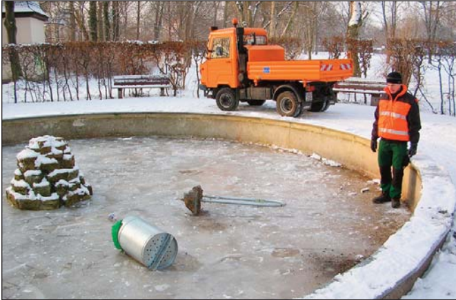
Ein Bild von Vandalismus

Einer der erst Ende 2011 neu angeschafften und im von-Seckendorff-Park eingebauten Müllbehältern wurde im Zeitraum vom 27.01. bis 29.01.2012 aus dem Betonfundament heraus gerissen und in den Springbrunnen geworfen. Es entstand hierbei ein Sachschaden von ca. 400 €.