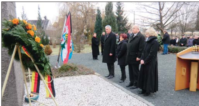
Nach der Kranzniederlegung - Gedenken an die Opfer des Faschismus.

Die zentrale Gedenkfeier des Landkreises fand am 27. Januar in Mumsdorf am Mahnmal des Ehrenfriedhofes statt. Ehren Gäste legten Kränze nieder.